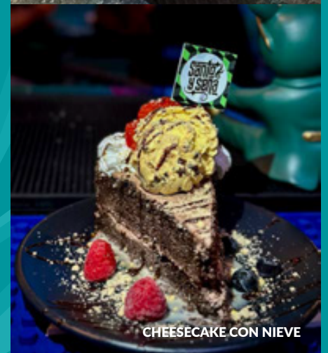
CHEESECAKE CON NIEVE