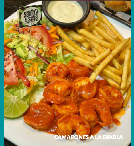
CAMARONES A LA DIABLA